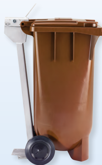
Conteneur équipé d'un support métallique