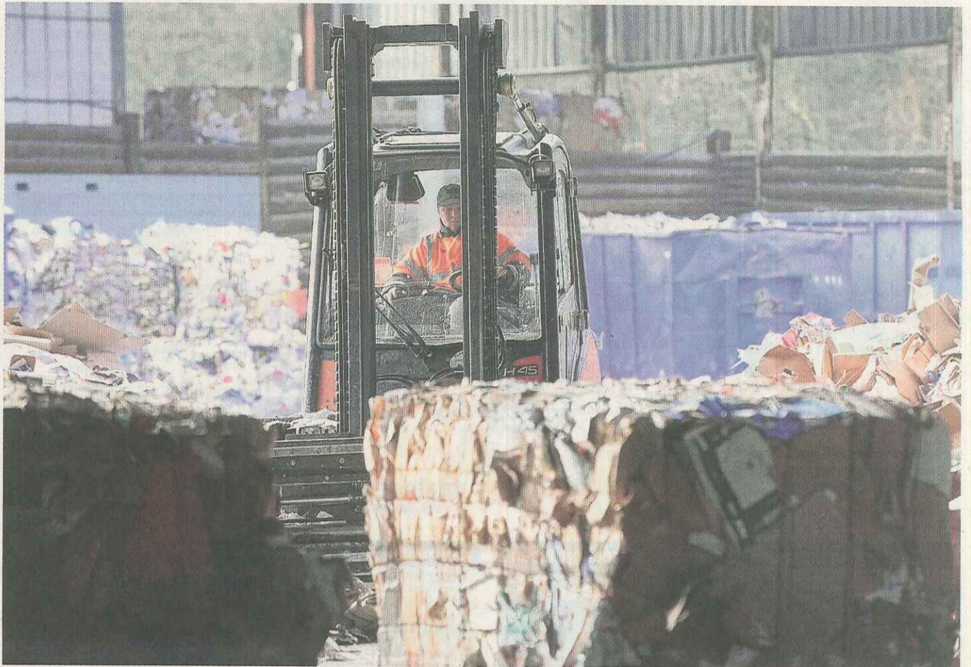
« Sur les 289 tonnes de gaz carbonique émises, on en compense le double », explique le responsable du programme (e) CO2.

Spécialisée dans le recyclage, la société Schroll a mis en place, fin 2010, le programme (e) CO2. L'idée : compenser les inévitables émissions de carbone liées à son activité de transport, en aidant l'ONF et l'association Cœur de Forêt à replanter des arbres.