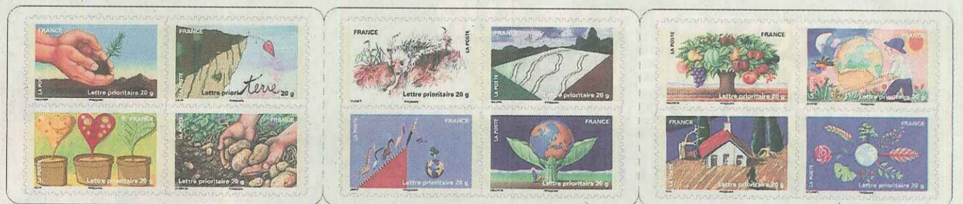
Le thème de la terre décliné sur douze timbres.

■ Organisée chaque année depuis 1938 par la Fédération française des associations philatéliques, avec le concours de la Poste, la fête du timbre se déroule cette année les 26 et 27 février dans 107 villes de France. C'est Saint-Louis qui accueille la manifestation pour les régions alsaciennes, dans