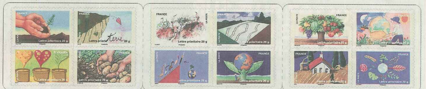
Le thème de la terre décliné sur douze timbres.

■ Organisée chaque année depuis 1938 par la Fédération française des associations philatéliques, avec le concours de la Poste, la fête du timbre se déroule cette année les 26 et 27 février dans 107 villes de France. C'est Saint-Louis qui accueille la manifestation pour les régions alsaciennes, dans